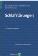
Spiegelhalter K, Backhaus J, Riemann D: Schlafstörungen, Hogrefe-Verlag; 2. überarbeitete Auflage 2011.